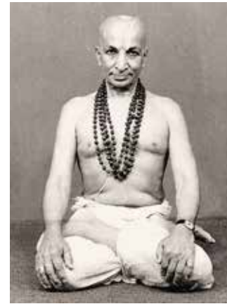
Sri T. Krishnamacharya